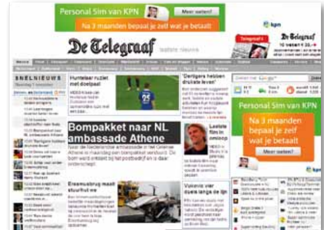
Roadblock (exclusief claimen van 2 posities)