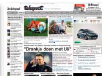
Display advertising: Telesport.nl