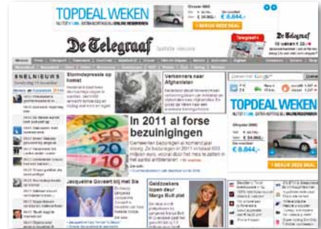
Full Roadblock (exclusief claimen van 3 posities)