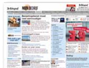
Display advertising: MijNBedrijf.nl