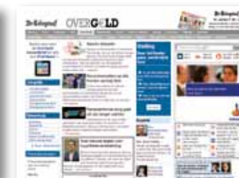
Display advertising: OverGeld.nl