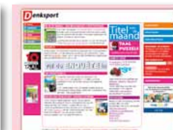
Display advertising: Denksport.nl