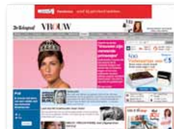
Display advertising: VROUW.nl

*SkyRadio.nl maakt geen onderdeel uit van het Channel Vrouwen.