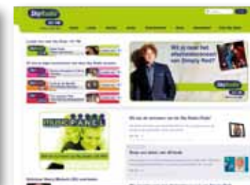
Display advertising: SkyRadio.nl