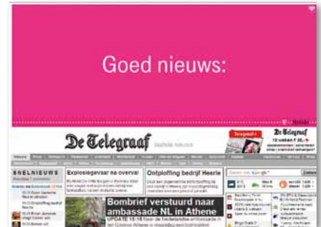
Flat Banner (expanded)