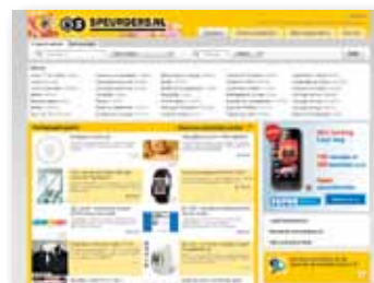
Display advertising: Speurders.nl