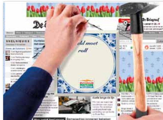
Homepage Take Over