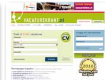
Display advertising: Vacaturekrant.nl