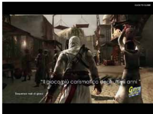
Full Screen Video