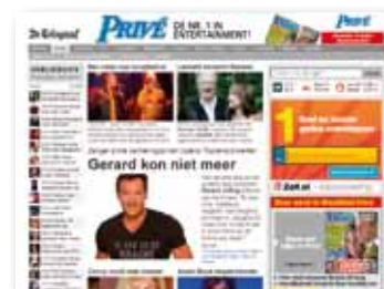
Display advertising: Prive.nl