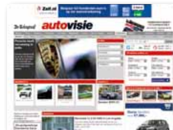
Display advertising: Autovisie.nl

Adverteren via Display Advertising betekent: adverteren op website(s) of webpagina('s) binnen ons netwerk, waarbij u de keuze heeft uit een aantal displayadvertenties ter presentatie van uw online campagne.