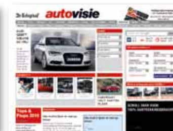
Display advertising: Autovisie.nl