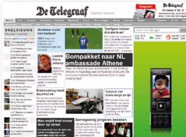
Half Page Ad